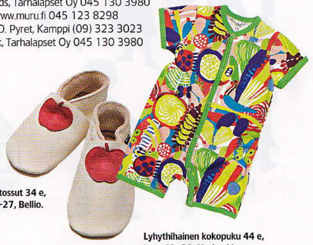
Omenantossut 34 e, koot 20-27, Bellio.