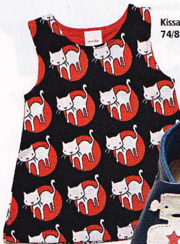
Kissa-mekko 40 e, koot 74/80-86/92, Muru.