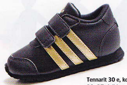
Tennarit 30 e, koot 20-27, Adidas.