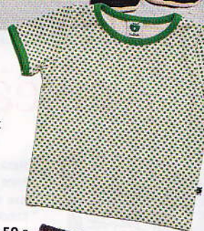
T-paita 23 e, koot 56-92, Småfolk.